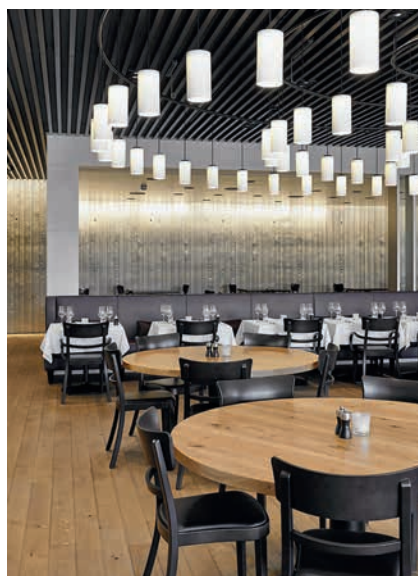
Restaurant «Baulüüt» von scheinlin syfrig Architekten – Campus Sursee in Oberkirch.

SIA-TAGE 2014 am Wochenende vom 9. bis 11. Mai. Alle Objektadressen, Führungstermine und Veranstaltungen der Baukunstschau finden sich auf der dreisprachigen Website www.sia-tage.ch . Dort kann man zudem eine Übersicht der gezeigten Bauwerke gratis als Smartphone-Applikation herunterladen.