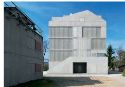
Das Brandhaus II im Ausbildungszentrum Rohwiesen der Zürcher Feuerwehr.

wurde vom SIA mit der «Umsicht»-Auszeichnung 2013 gewürdigt.