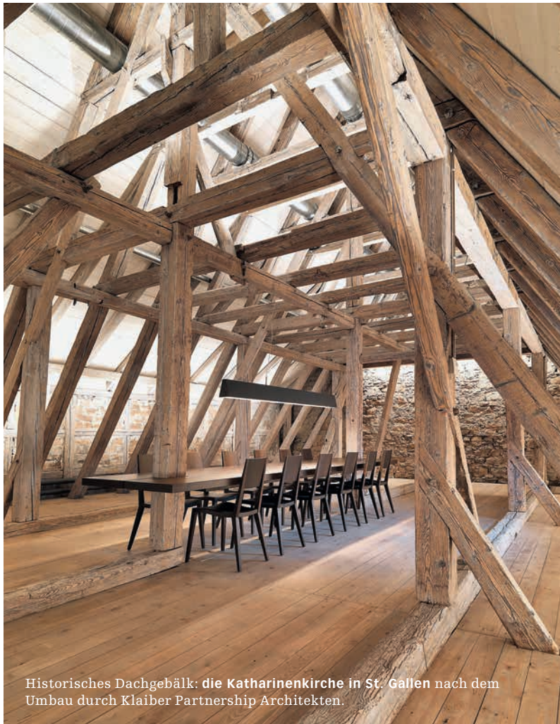
Historisches Dachgebälk: die Katharinenkirche in St. Gallen nach dem Umbau durch Klalber Partnership Architekten.

D ie SIA-Tage der zeitgenössischen Architektur und Ingenieurbaukunst finden 2014 zum achten Mal statt. Die 2006 unter dem Namen «15n» von der SIA-Sektion Waadt ins Leben gerufene Werkchau hat sich mittlerweile zum wichtigsten Anlass für die publikumswirksame Vermittlung aktuellen Bauens entwickelt. So zog es 2012 mehr als 25000 Besucher zu den 330 neuen Bauwerken von SIA-Fachleuten. In diesem Jahr findet die Werkchau der Architektur- und Ingenieurbaukunst zum zweiten Mal in der