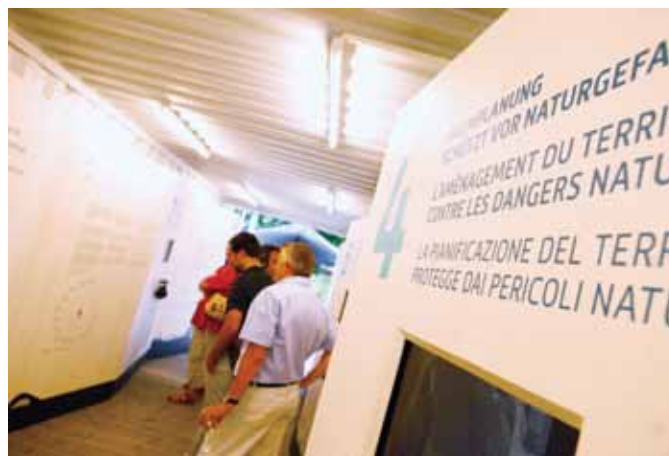
Il container espositivo alla sua seconda tappa, sulla Bahnhofplatz di Lucerna

I risultati delle votazioni tenutesi nella prima metà del 2012 testimoniano un accresciuto interessamento alla pianificazione territoriale da parte dell'opinione pubblica, tuttavia la fiducia per quanto riguarda l'efficacia delle misure prese in materia sembra essere diminuita. Con la mostra itinerante «Idea spazio territorio», il Politecnico federale di Zurigo e la SIA, i due promotori, vogliono mettere in risalto tutto ciò che la pianificazione territoriale ha fatto e sta facendo e non (tanto per una volta) ciò che non è riuscita a fare.