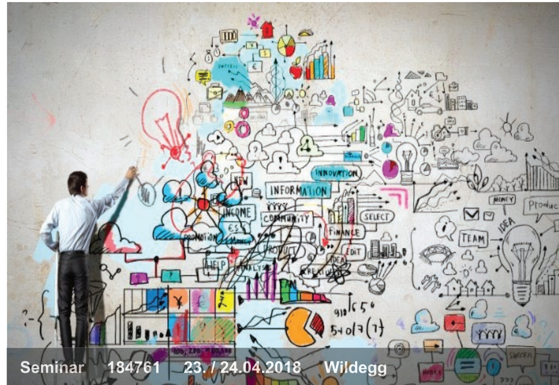
Seminar 184761 23. / 24.04.2018 Wildegg